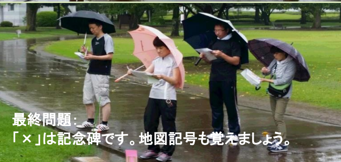
最終問題： 「×」は記念碑です。地図記号も覚えましょう。