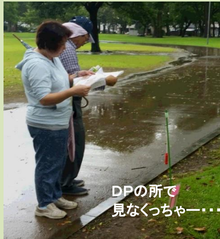
DPの所で 見なくっちゃー...

競技終了後、間違えたポイント全てを全員で廻り、何がミスの原因なのかを検証し合い、トレイル競技の奥深さを再認識していただきました。雨は昼前から上がり、一部の方はフラッグ未設置ながら、ポイントO用地図を使い、公園内のコースを一回りされました。