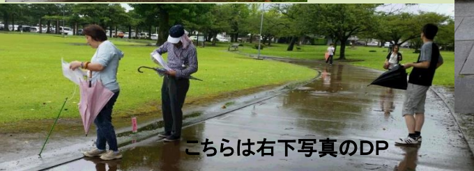
こちらは右下写真のDP