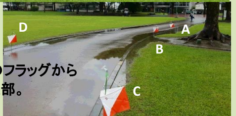
DPは手前のフラッグから 約50m中央部。